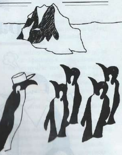
Resnica avtoritete: ko si mnenja ne ustvarimo sami, ampak verjamemo izkustvu drugega.

Recimo raje tako: nasprotovalno razmišljanje jih doslej še ni. Tehnologija je v zadnjem stoletju neskončno napredovala, družba nikakor. Samo 100 let je minilo, odkar je v zrak poletelo prvo letalo, negotovo in za kratek čas, danes pa letimo v Avstralijo in se pritožujemo, če ni interneta. Koliko pa smo v tem času napredovali kot družba? Ljudje pri rojstvu (še vedno) nimamo enakih "štartnih pozicij". Predsodkov in stereotipov ni nič manj kot pred stoletjem, Evropa se danes sooča s posledicami kolonialistične preteklosti, v načinu razmišljanja smo še vedno bolj podobni jamskemu človeku kot svetovljanu. Zato v branje priporočam de Bonovo knjigo Priručnik za pozitivno revolucijo , kjer govori o tem, kaj mora vsak od nas narediti, da bomo vsi živeli v boljši družbi. Vsi bi se morali truditi, da bi bili čim bolj učinkoviti – morali bi si zastaviti (smiselni!) cilj in ga doseči. Torej biti manj egotripovsko